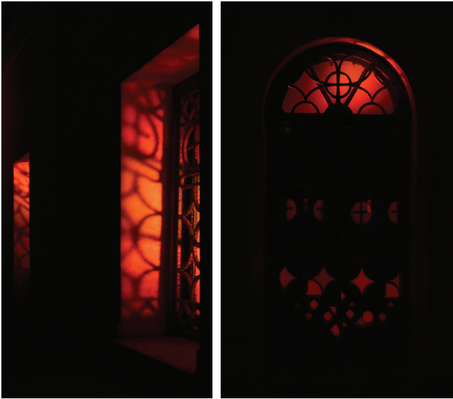
Εικ. 3 Προβολή σχεδίου του κιγκλιδώματος του παραθύρου πάνω στο λαμπά του από πολυφασματικές πηγές φωτισμού LED, εγκατεστημένες εντός του ναού.